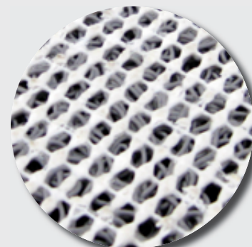
Thibaude ajourée (14mm)