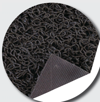
Thibaude pleine (10 mm)